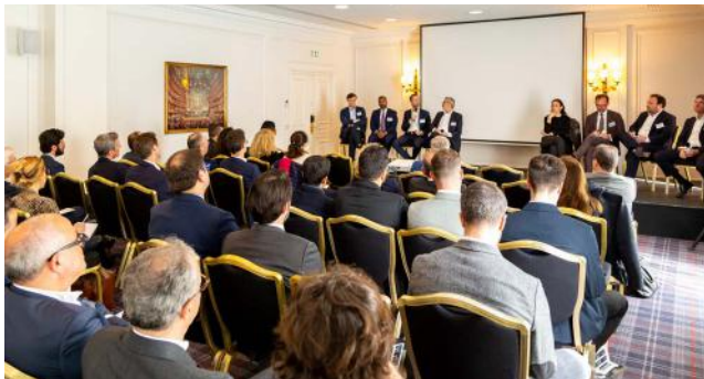
Intervention GRI France 2023