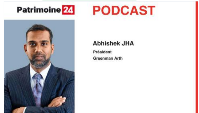
Podcast en partenariat avec Patrimoine 24