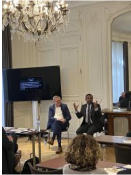
Partenariat et Road Show avec la Compagnie des CGP