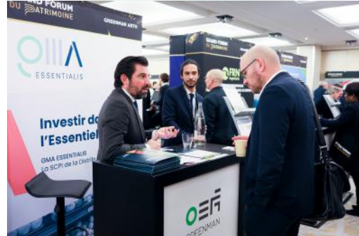
Le Grand Forum du Patrimoine 2023